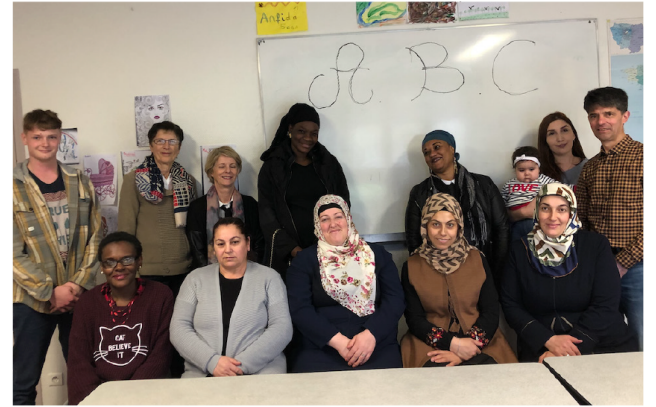
Les apprenantes et leurs professeurs bénévoles.

Mais ce sont la convivialité, la bonne humeur et la richesse des échanges qui restent notre principal moteur !